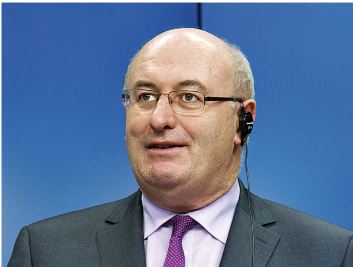
Phil Hogan, commissario UE all'agricoltura

L'ultima gara per la vendita, che ha avuto luogo l'8 novembre scorso, si è chiusa con l'assegnazione di 30.000 tonnellate. Le scelte di svuotare i magazzini attuate dalla Commissione UE negli ultimi mesi non hanno impedito il miglioramento dei prezzi sia per il latte crudo alla stalla , sia per il latte scremato in polvere. Ciò significa che c'è stata un'attenta gestione delle scorte da parte della Commissione.