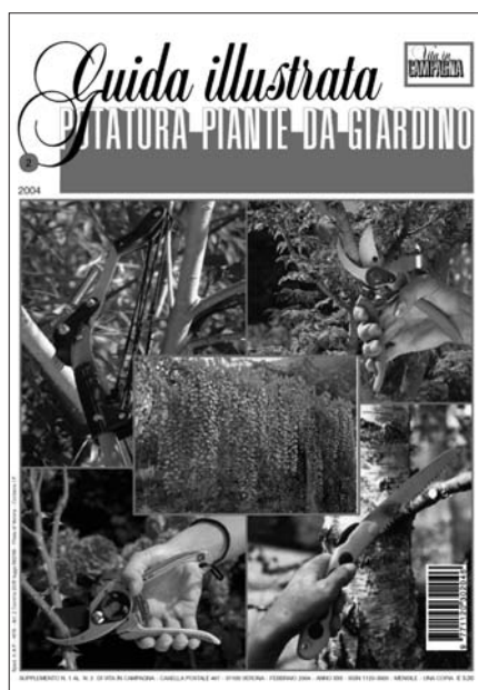
Guida illustrata alla potatura delle