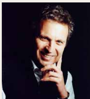
Marco Calliari Casa di campagna. Presente tutti i giorni della fiera