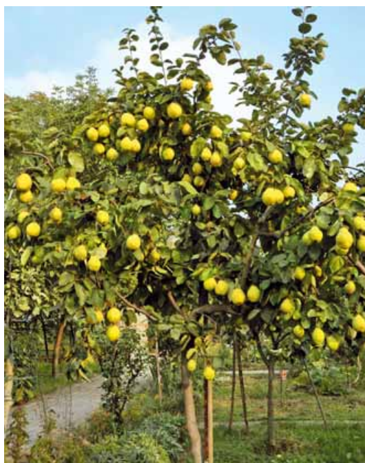
Il cotogno è un albero da frutto originario dell'Asia (Iran e Turkestan), apprezzato per la bellezza dei fiori e del fogliame, oltre che per l'abbondante produzione di frutti

Gli alberi hanno anche un valore ornamentale , per il fatto che assumono spontaneamente un bel portamento globoso oppure un po' piramidale. Le foglie sono ampie, di forma ovata, coriacee e di un bel verde carico. I fiori assai grandi, di un bianco leggermente rosato, sono vistosi e spuntano all'estremità dei nuovi rametti. Fiorisce in aprile.