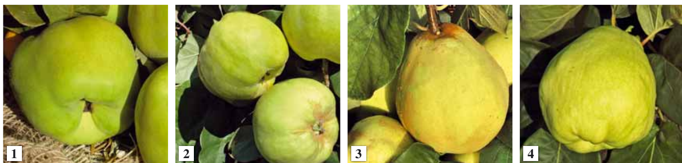
Le varietà più diffuse. Per il melo cotogno, o cotogno maliforme sono «Comune» (1) e «Champion» (2); per il pero cotogno, o cotogno piriforme sono «Comune» (3) e «Gigante di Vranja» (4)

pion» e il pero cotogno «Gigante di Vranja», dai frutti più grossi e saporiti. Le mele cotogne pesano 200-300 grammi e le pere cotogne anche 400-450 grammi, con punte di 600-700 grammi.