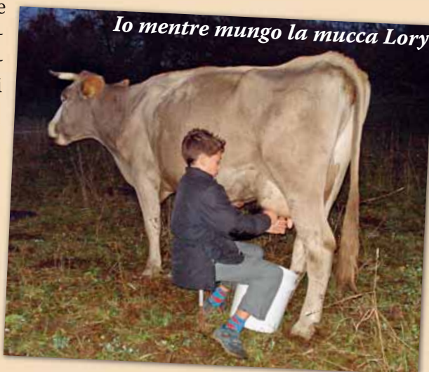
Io mentre mungo la mucca Lory