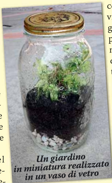
Un giardino in miniatura realizzato in un vaso di vetro

È semplice. Nel giardino che realizzerete hanno tutto il ne-