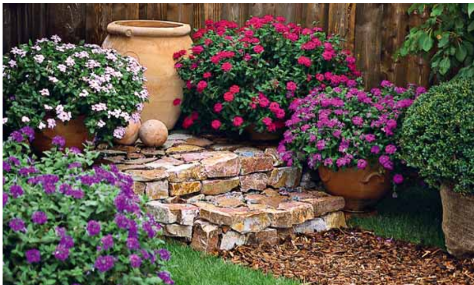
Ecco le meravigliose fioriture che può regalare Verbena temari, pianta da fiore ideale da coltivare, sia in vaso che in piena terra, in posizioni di mezz'ombra. Si osservi il bel contrasto cromatico creato dai fiori con il fogliame

delle piante, rispetto alle posizioni soleggiate, determina di conseguenza uno sviluppo ed una fioritura tardivi, al momento del loro acquisto scegliete esemplari già ben formati, in modo da realizzare airole, bordure e vasi a pronto effetto.