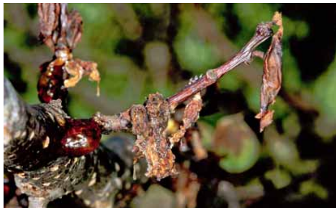
Foto 3 - Fiori e rametti disseccati in seguito ad attacco di monilia

Da non trascurare è la presenza d'inoculo in campo (foto 3). I frutti colpiti da