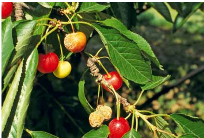
Foto 1 - Frutti di ciliegio colpiti da monilia

Dall'inizio della fioritura è consigliabile eseguire un intervento quando si prevedano eventi piovosi o condizioni di elevato tenore d'umidità. Diversamente, se l'andamento stagionale è poco favorevole allo sviluppo di moniliosi,