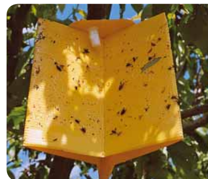
Trappola cromotropica gialla per la cattura di Rhagoletis cerasi

Distribuire, in funzione del volume della chioma, 200-500 mL di soluzione/pianta.