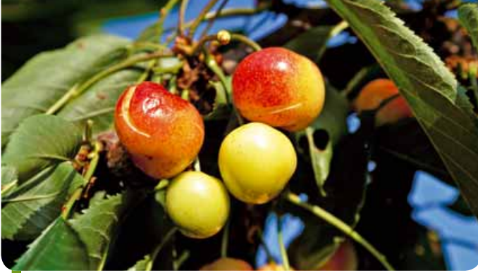
Foto 2 - Ferite e microlesioni dei frutti causate da grandinate o piogge sono le vie di accesso della monilia

è opportuno eseguire un intervento «precauzionale» nella fase di caduta petali. Anche se l'umidità atmosferica è limitata, la presenza dei residui fiorali può creare una situazione favorevole allo sviluppo delle moniliosi che non dobbiamo trascurare.