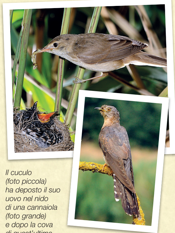
Il cuculo (foto piccola) ha deposto il suo uovo nel nido di una cannaiola (foto grande) e dopo la cova di quest'ultima è nato il pulcino. La cannaiola non sa che il figlio non è suo, anche se non le assomiglia, e lo nutrirà fino a quando non sarà in grado di volare