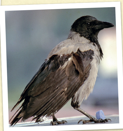
Una cornacchia ha individuato un pezzetto di plastica ed è scesa nel cortile di una casa, sicuramente influenzata dalla sua curiosità

Secondo imputato è la cornacchia, alla quale si attribuiscono quasi gli stessi reati della gazza (che tra l'altro appartiene alla medesima famiglia, quella dei corvidi). La cornacchia è molto intelligente e curiosa, ed è attratta da tanti oggetti che raccoglie più che altro per gioco. Un sassolino, un pezzetto di plastica, un bastoncino possono diventare un giochino occasionale, ma non si può certo parlare di furti di oggetti fatti intorno alle abitazioni! Quindi, anche in questo caso piena assoluzione!