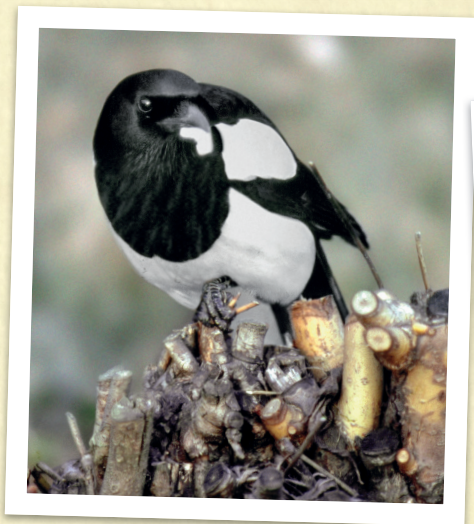
Una gazza ha trovato un pezzetto di stagnola e l'ha raccolta per portarla al proprio nido

va l'interesse che questo uccello ha per gli oggetti luccicanti. Pare che sia dovuto all'abitudine del maschio di adornare occasionalmente (quindi non sempre) il nido con materiale luccicante per compiacere la compagna e quindi consolidare il proprio rapporto di coppia. Insomma, è come quando il papà porta un mazzo di fiori alla mamma!