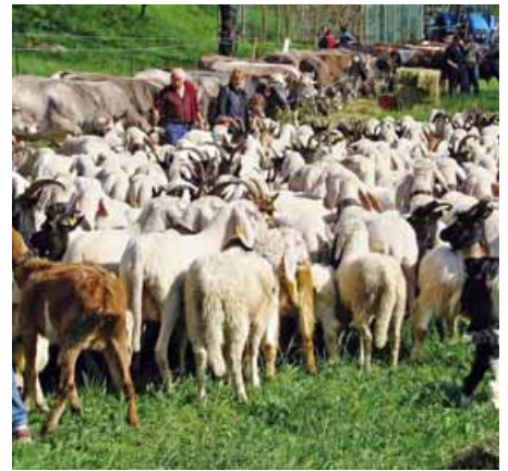
Domenica 19 ottobre si svolge a Doccio di Quarona (Vercelli) la «Fiera Valsesiana di ottobre»

Domenica 19 ottobre si svolge a Doccio di