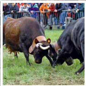
Valle d'Aosta - Batailles des Reines, Gignod

All'interno dell'arena Croix Noire all'ingresso della città di Aosta si svolge, domenica 19 ottobre , la «Bataille des Reines» (Battaglia delle Regine). Un appuntamento importante per molti abitanti della regione ma anche per chi voglia scoprirne da vicino un volto poco conosciuto.