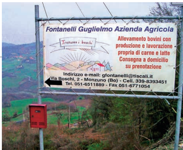
L'Azienda si trova a 700 metri sul livello del mare

Ma continuiamo con la sua storia. Il nuovo piano regolatore modifica la sua terra in zona di rispetto urbano e lui è costretto a trasferirsi. Nell'ottobre del 2000 acquista l'azienda «I Bo-