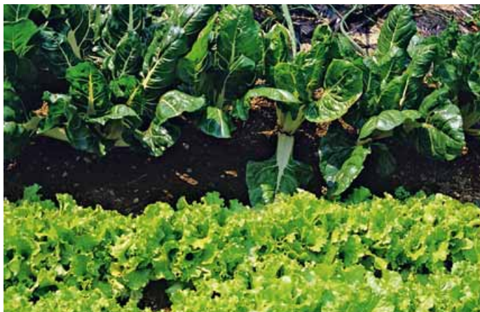
Consociazione di lattughe e bietole da coste non ancora completamente sviluppate