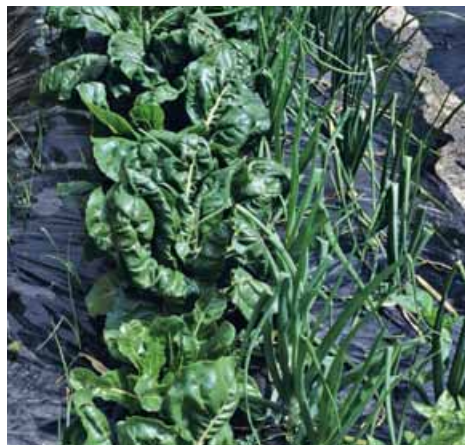
Anche in un'aiola pacciamata si può attuare la consociazione, in questo caso tra bietole da coste e cipolle