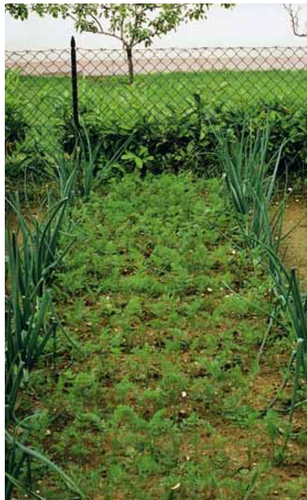
Consociazione «classica» di carote e cipolle (queste ultime ai bordi dell'aiola)

Per attuare le consociazioni con la maggiore razionalità possibile è necessario scegliere accuratamente le piante